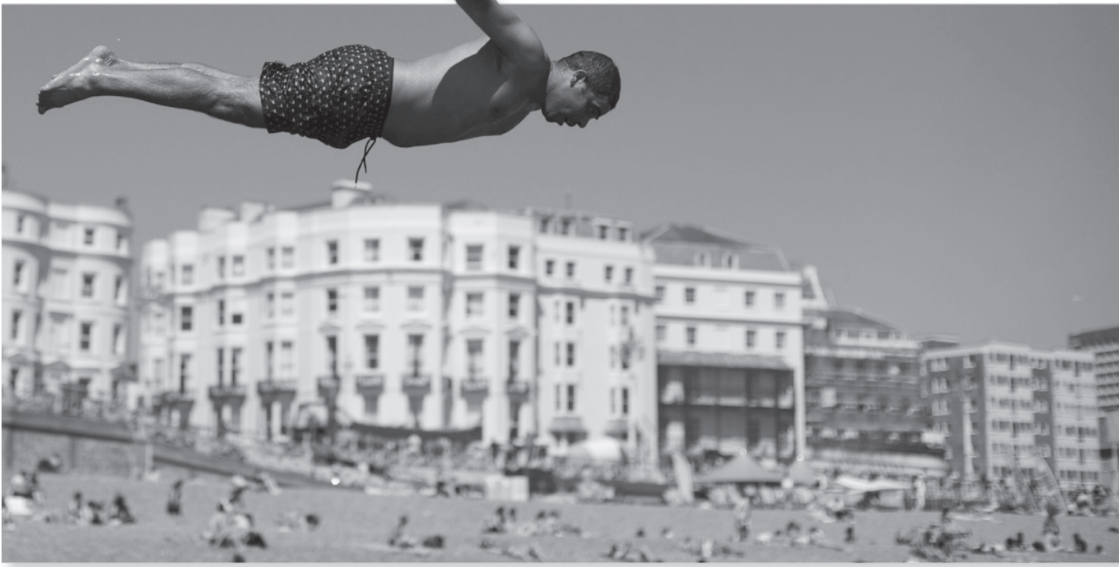
CUACA PANAS DI BRIGHTON - INGGRIS

Seorang pria menyelam ke laut saat orang-orang menikmati cuaca panas di pantai Brighton, di Brighton, Inggris, Selasa (1/6).